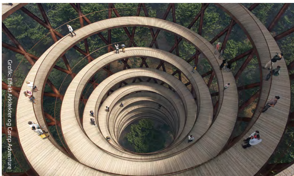
Grønik: Effekt Arkitekter og Camp Adventure

Projektet vil øge antallet af besøgende til området, og skabe nye arbejdspladser både på Camp Adventure og hos mange lokalt forankrede følgevirkninger.