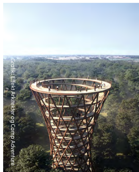
Grønik: Effekt Arkitekter og Camp Adventure